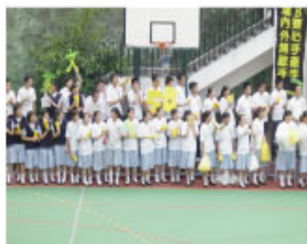
畢業班班際足球比賽