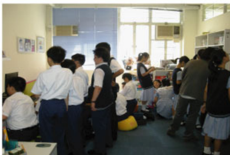
The English Corner bustled with students.

The English Corner has been set up in a bid to provide a congenial environment wherein students are encouraged to use English as a part of their life. It is open every day at lunch and after school. All students are welcome to chat, play games, try out computer software (including English learning software, software for learning EMI subjects and English learning role play games), listen to music and read books there. They can also borrow items, such as CDs and books.