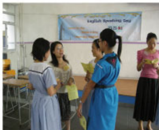
Teachers and students enjoyed a chat in English.