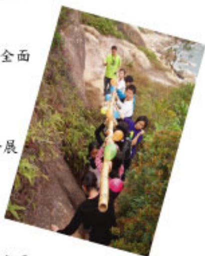
能把「同心竹」穿越崎嶇的山崖，關鍵在乎溝通和合作。

本校一向注重學生的全人發展，除致力提升學術水平外，亦提供大量和多元化的課外活動及非學術發展之機會。至於家長方面，如何能協助建立子女的SLP呢，當然是支持和鼓勵他們積極參與，使每一個「林護人」都能具備其代表之特質。